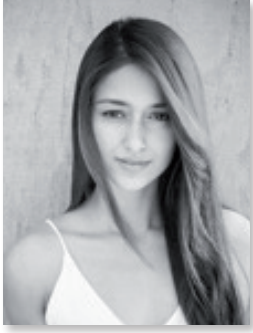
ILEANA D'CRUZ ACTRICE/INDE

Elle est l'une des actrices les plus glamour du cinéma indien. Élue de nombreuses fois comme l'une des cent plus belles femmes de la planète, Ileana d'Cruz , née à Mumbai, est aussi la personnalité préférée des Indiens qui l'ont placée pour la cinquième année consécutive en première place dans leur cœur, selon le New Delhi Weekly. Elle est notamment pressentie pour incarner une James Bond Girl au côté de Daniel Craig.