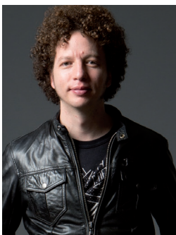
MICHEL FRANCO REALISATEUR & SCENARISTE/MEXIQUE

Il se fait remarquer en 1995 par deux courts-métrages Tous à la manif (Prix Jean Vigo 1995) et Jeux de plage (1995). Il tourne en 1999 pour Arte Les Sanguinaires dans le cadre de la collection « 2000 vu par... ». Son premier long-métrage de cinéma Ressources humaines (2000), radiographie du monde de l'entreprise, est couronné de deux Césars : Meilleure première oeuvre et Meilleur jeune espoir pour Jalil Lespert. La question du travail est au coeur de son deuxième film, L'Emploi du temps , qui obtient le Lion d'Or-Cinéma du Présent au Festival de Venise en 2001. Vers le Sud (2005) est également présenté à la Mostra. Entre les Murs décroche la Palme d'Or en 2008, un vote à l'unanimité pour ce long-métrage qui plonge dans une classe de français d'un collège parisien. Suivent les long-métrages : La Fuente (segment du film collectif 7 jours à La Havane ), Foxfire, confessions d'un gang de filles (2013), Retour à Ithaque (2014) qui reçoit l'Abrazo du Meilleur film au festival de Biarritz Amérique Latine. Laurent Cantet retourne à Cannes avec L'Atelier présenté dans la section Un Certain Regard.